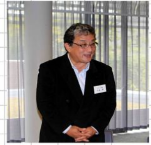
会場の効果演出担当していただいた千葉副支部長