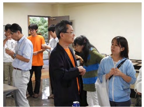
講演会、懇親会風景